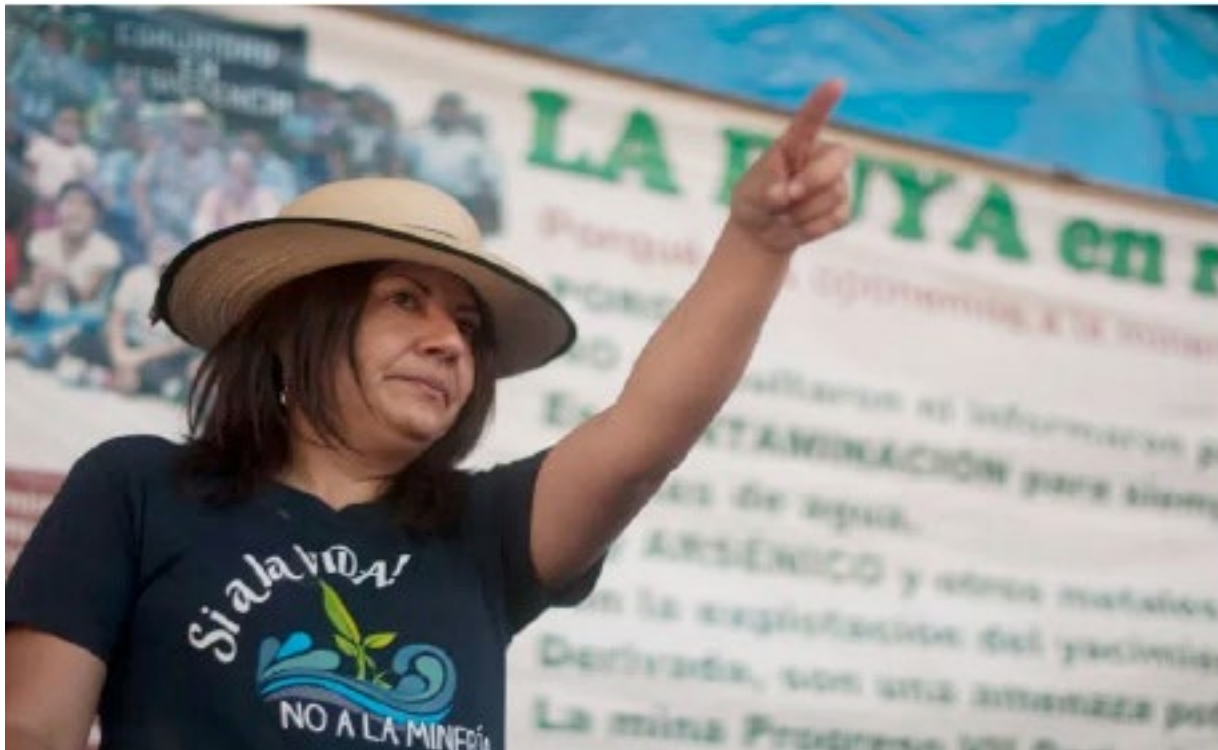
Fotografía: Yolanda Oquelí Defensora de la Puya. Radio Temblor.org