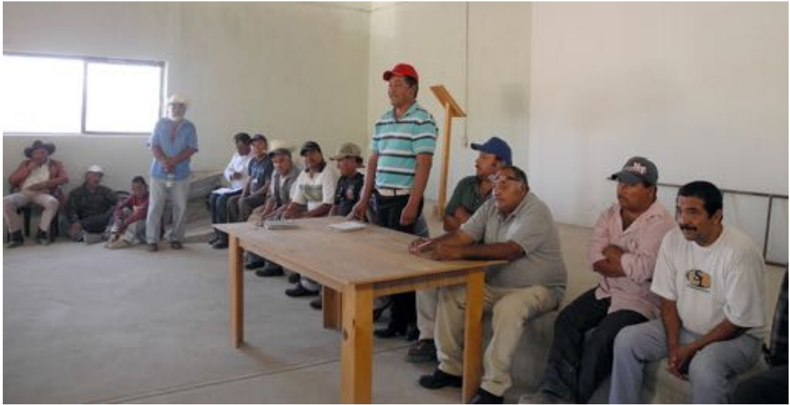
Reunión de los miembros del ejido La Sierrita, diciembre del 2012.