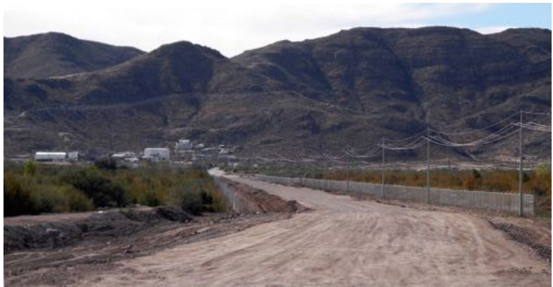
Vista de la mina La Platosa.

Los resultados que arroja nuestro análisis en este informe incrementan nuestra preocupación de que las misiones canadienses promueven y protegen los intereses de las empresas mineras canadienses a costa de los derechos individuales y colectivos de las comunidades afectadas. En este caso, los mecanismos de rendición de cuentas de parte del Estado canadiense sobre los abusos