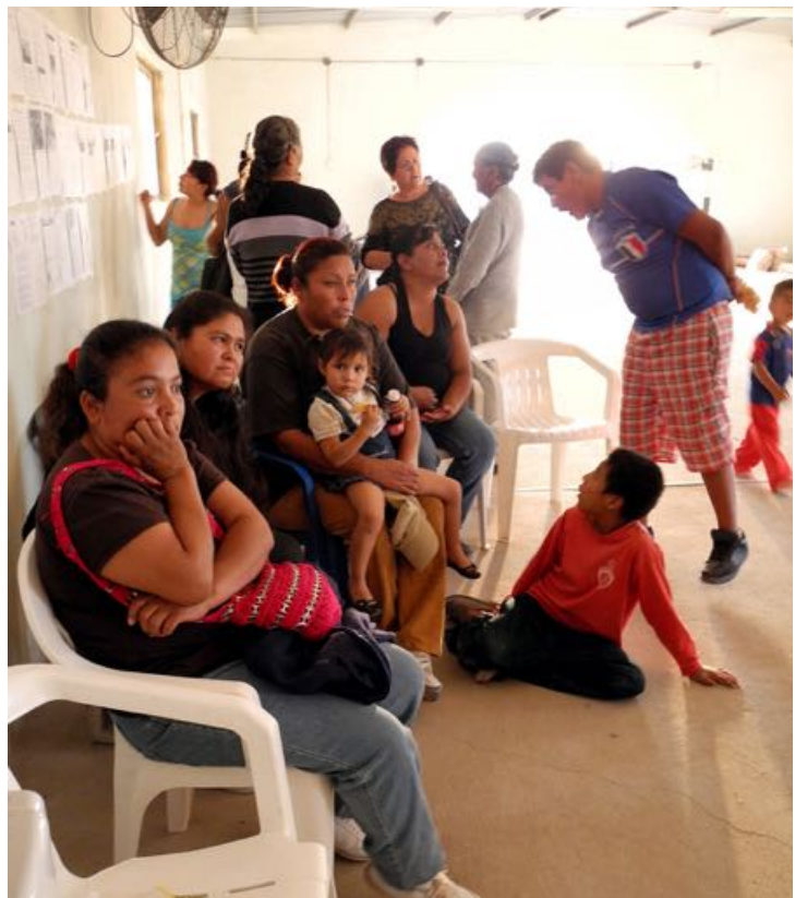
Reunión de los miembros del Ejido La Sierrita, diciembre del 2012.

El sábado 28 de julio, temprano por la mañana,