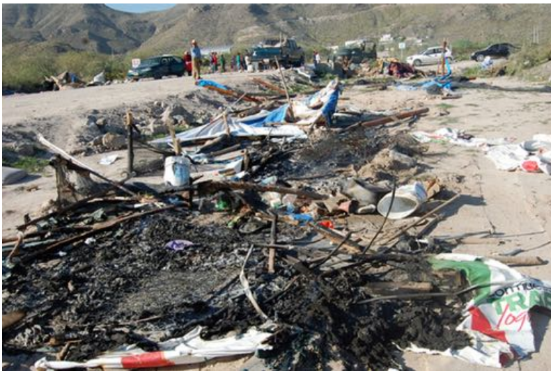
Lo que se quedó del plantón del ejido La Sierrita poco tiempo después del ataque del 24 de octubre del 2012.