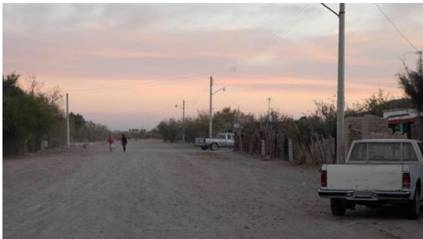
Anochecer, ejido La Sierrita.