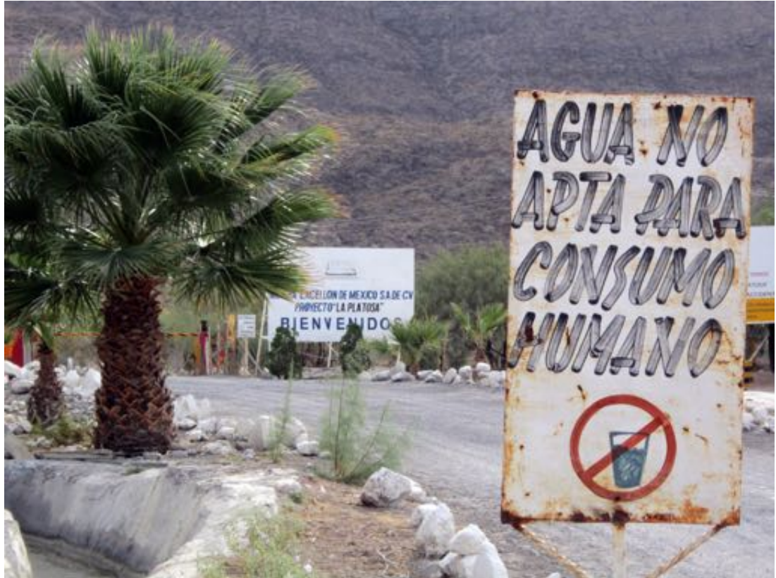
Señal en La Sierrita.

ño que haya mencionado la fuerza antes que la negociación”, extrapolando que “quizás sea el ultimátum que se le comunique a los manifestantes – que las autoridades dismantlarán el campamento, a menos que ustedes lo dismantelen y negocien”. 13 Cahill indicó que la empresa decidió no declarar fuerza mayor por el momento, dependiendo del resultado de una reunión que el gobierno federal había agendado para el próximo lunes, 30 de julio “en la base local del ejército (federal).” La reunión se celebraría con las “Secretarías de Gobernación, de Economía, y de Trabajo a nivel federal; la Secretaría de Gobierno, de Trabajo, y de Desarrollo Económico de Durango; la policía federal y local; el ejército”. 14 Estimaba que una reunión con el Gobernador de Durango quizás no fuera necesaria y podría “crear confusiones”. 15