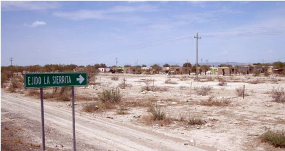
Ejido La Sierrita.

En 2011 y 2012, se interpusieron dos quejas ante organismos canadienses que ilustran las violaciones, por parte de la empresa, del Contrato de Ocupación Temporal de la tierra, y su violación de los derechos laborales y de los ejidatarios. Como resultado, en el periodo que concierne este informe, las autoridades canadienses en Ottawa y la Embajada en México contaban con un considerable conocimiento del conflicto.