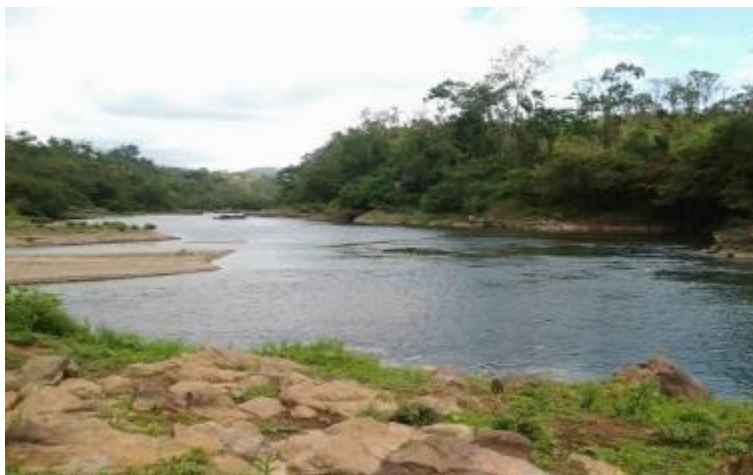
Punto donde se unen el Río Yaoska y el Río Tuma, Rancho Grande

Rancho Grande tiene hermosos ríos como el Yaoska y el Pavón (ambos rodean el cerro Pavón, sede de la mina). En un punto del territorio, se unen al río Tuma, en un lugar donde se crea una pequeña playa que queda a resguardo de la corriente y se puede nadar. Hay un paisaje amplio y verde alrededor. Lo mejor de esta propuesta es que es incompatible con la minería y que logró que se sentaran a dialogar, después de varios años, los Guardianes de Yaoska, la Alcaldía y las organizaciones locales del municipio. Tratando de ofrecer una oportunidad de desarrollo a Rancho Grande que beneficie a toda la población, se realizó un recorrido conjunto con todos los actores por los potenciales puntos turísticos, terminando en el punto de confluencia de los ríos. Y tengo que decir que fue un placer nadar en el Yaoska.