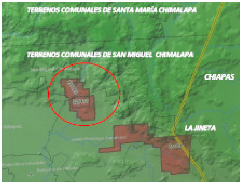
Mapa 1 Ubicación de las tres concesiones mineras

Desde hace 6 años, Secretaría de Economía Federal comenzó a otorgar la expedición de tres concesiones mineras con los números 231753, 225472 y 232208 (yacimientos de cobre, plata y oro, así como de puzolana –cemento de alta calidad-), las tres ubicadas en la porción sureste del territorio comunal chimalapa, en los límites de San Miguel con los municipios de Zanatepec y Tapanetepec, y en zona limitrofe con el estado de Chiapas (ver mapa 1).