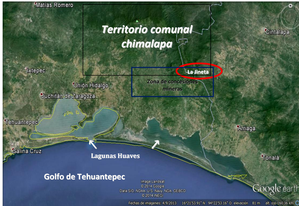
Mapa 3.- Ubicación de Lagunas Huaves y Golfo Tehuantepec

Además, por la explotación de estos yacimientos, los ríos Ostuta, Zanatepec y Novillero correrían peligro de ser contaminados, no sólo porque la superficie concesionada atraviesa el nacimiento de los ríos, sino sobre todo, por los escurrimientos de materiales tóxicos acumulados -sin hablar ya de derrames- viéndose más gravemente afectadas, las lagunas costeras ikoots (huaves), territorio ancestral de este pueblo indígena, cuyas comunidades viven de la pesca, así como el propio Golfo de Tehuantepec (ver mapa 3).