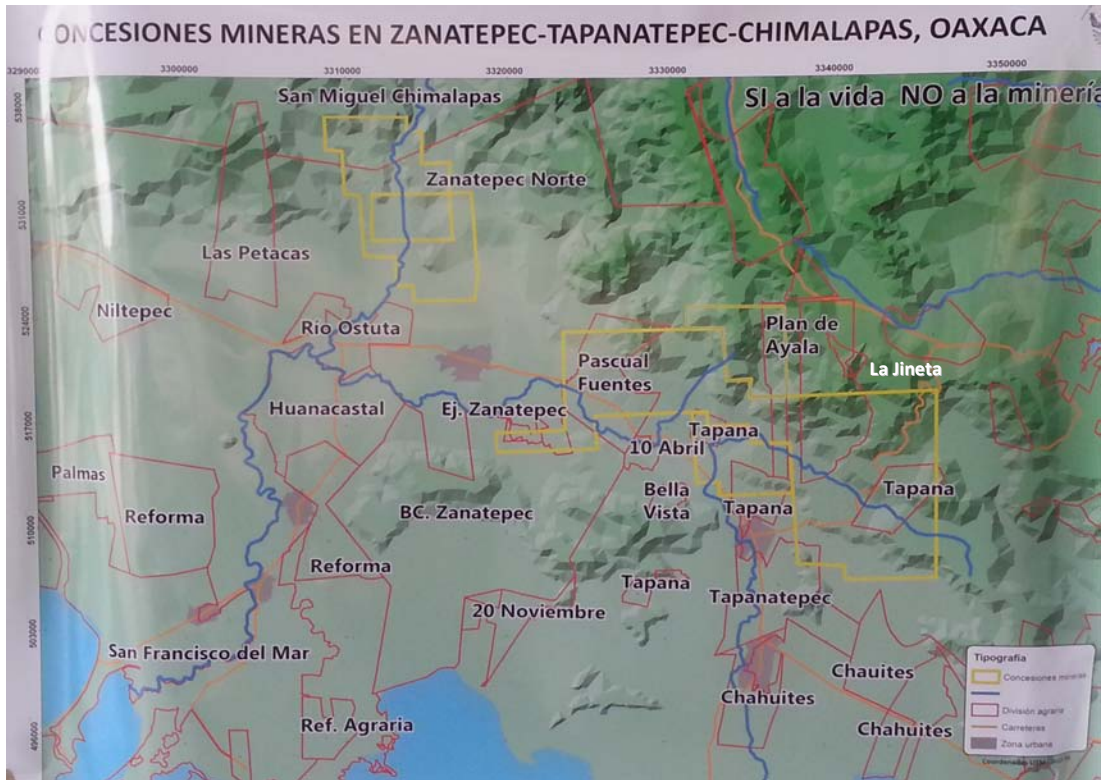
Mapa 4.- Concesiones mineras (en amarillo), poblados y predios afectados (en rojo)